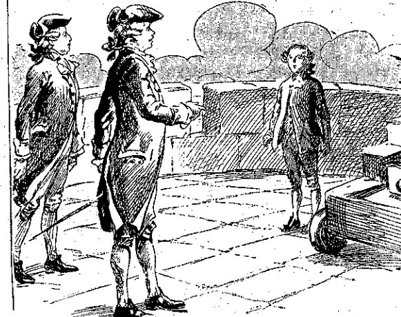
«Τί κάνεις ἐδῶ, μικρέ;» (Σελ. 270 στ. β')

χρῶνος καὶ νὰ τρέχουν κατ' εὐθείαν γραμμὴν, ἀμιγλῶμενα ποῖον νὰ πρωτο- φθάσῃ εἰς τὸ ἄκρον τοῦ διαδρόμου, ὅπου